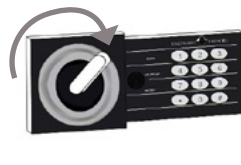
*Modèles HES90/140 - HED25/40

For HES and HED, take out the plastic cover beside the "LOW BATTERY" and plug-in the key and turn as show in figure. Turn the handle, as shown in figure below, to open the safe.