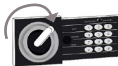
*Modèles HES15 /25 / 30