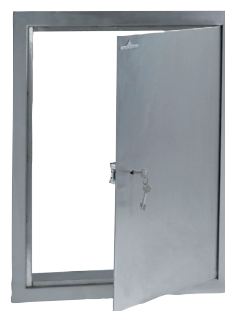
Portillon inox de façade avec serrure à double panneton certifiée A2P.