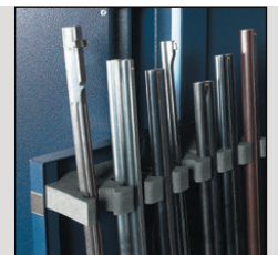
Supports pour armes spécialement conçus pour recevoir tous types de canons.