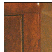
Coloris standard Loupe d'Orme