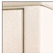
Coloris en option gris clair