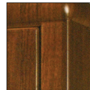
Coloris en option marron foncé