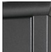
Coloris en option gris foncé