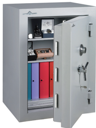
Modèle Zephyr Duo 5127