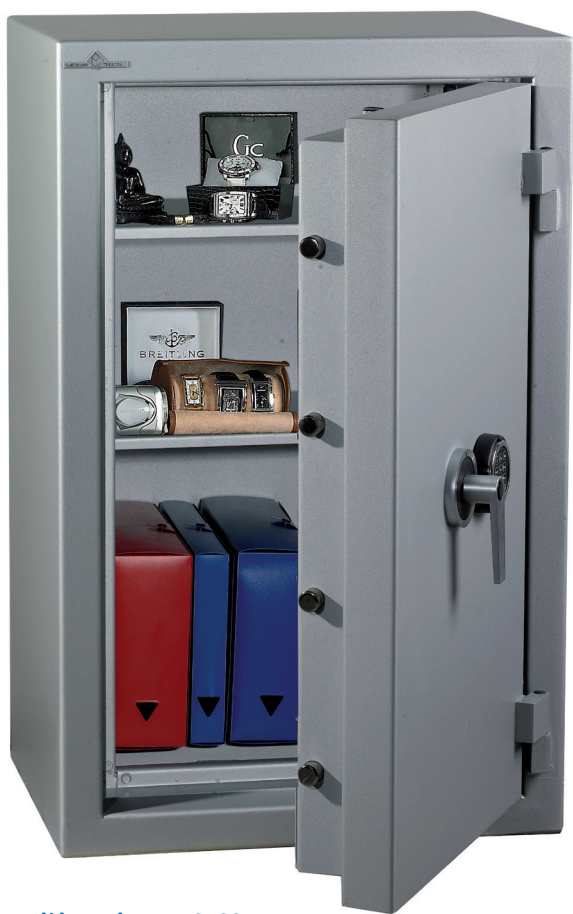
Modèle Zephyr Duo 3123

Classe 3 • Norme Européenne EN 1143-1 • Label A2P.E. • Valeur assurable : 55 000 euros Ignifuge papier 30 minutes • Norme Européenne EN 15659 • Label S30P