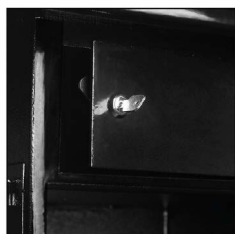
Un coffre intérieur fermant à clé