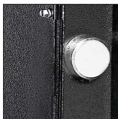
Verrouillage haute sécurité par pènes tournants antisciage de 38 mm.