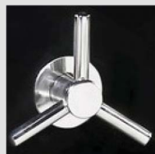
Poignée étoile à 3 branches