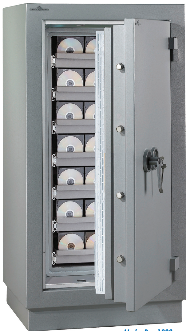
Media Duo 1280.

Valeur assurable : 25 000 € Classe 1 ou 35000 € Classe 2.