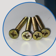
Kit de fixation inclus