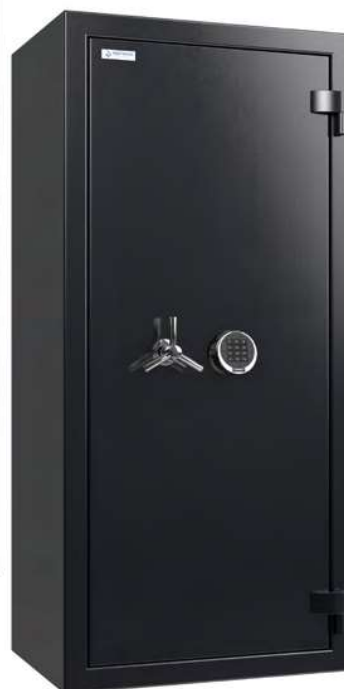
Dimensions du coffre intérieur

Modèle avec serrure électronique. Exemple d'aménagement pour 14 armes.