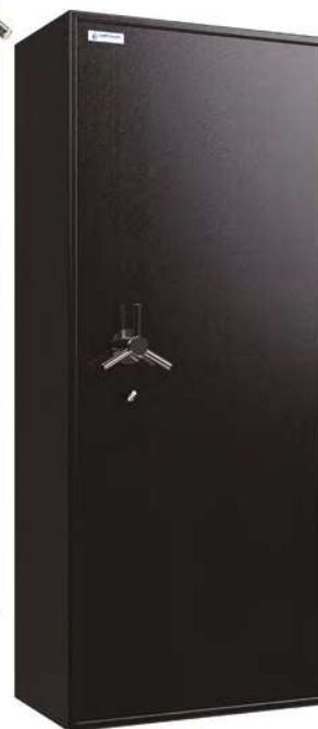
Dimensions du coffre intérieur