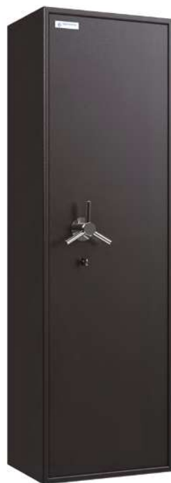
Dimensions du coffre intérieur