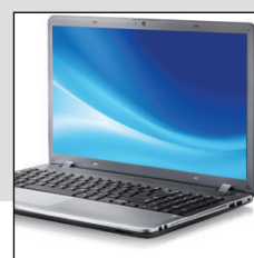
Idéal pour ordinateur portable 17 pouces. Uniquement pour les modèles HS 460-02 et HS 470-02.