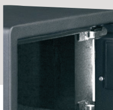
Eclairage intérieur par leds blanches.