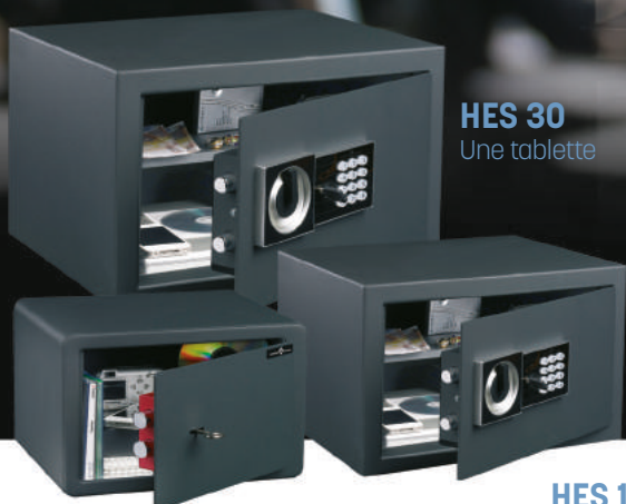
HES 30 Une tablette